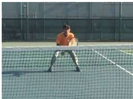
ワイドスタンス & 低い姿勢