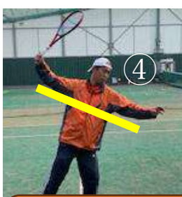
上がり気味のテイクバック

ありがちなミス ●③のようにテイクバックで肘が下がるとボールが上に行きアウトし易くなる。④のようにテイクバックを上げすぎると上体が前傾姿勢となりネットが増えてしまうので注意しましょう！