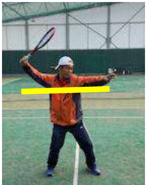
良いテイクバック

攻めストロークの良い テイクバックの目安 ●まずセットを高くしていきましょう。肩と肘の高さを合わせるとレベルスイング(真横に水平に振る)が行いやすくなります。