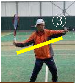
下がり気味のテイクバック

ありがちなミス ●①通常時の打点【腰の硬さ】は前足の軸足のライン上に在るのが正解ですが、②高い打点を軸足ライン上で打つととても窮屈になります。右上の写真のようにやや前でボールをとらえましょう。