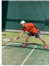
② 相手の体制が崩れた時