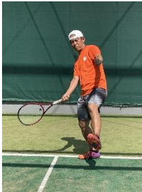
① 相手が下がった時